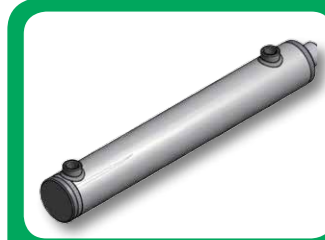
Kolben/ Kolbenstange (siehe Maßblatt)