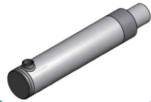
Kolben/ Kolbenstange (siehe Maßblatt)