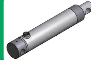
mit Feststange und Querbohrung